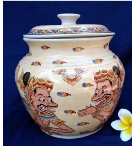
Gambar 2. Sangku Sugriwa Subali

Hanuman. Penggambaran figur pada badan keramik ada yang terkait dengan satu cerita ada juga yang tidak terkait. Visualisasi karya-karya keramik tersebut dapat dilihat seperti gambar berikut: