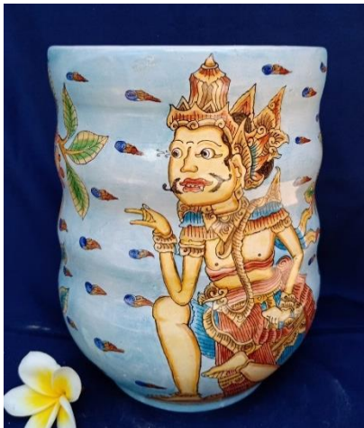
Gambar 5. Rama Vase