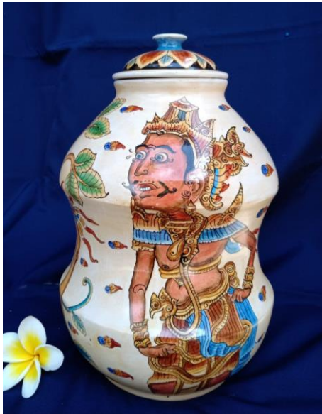
Gambar 11. Rama Jars Sumber: Dok I Wayan Mudra 2020.