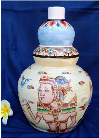
Gambar 10. Laksmana Vase