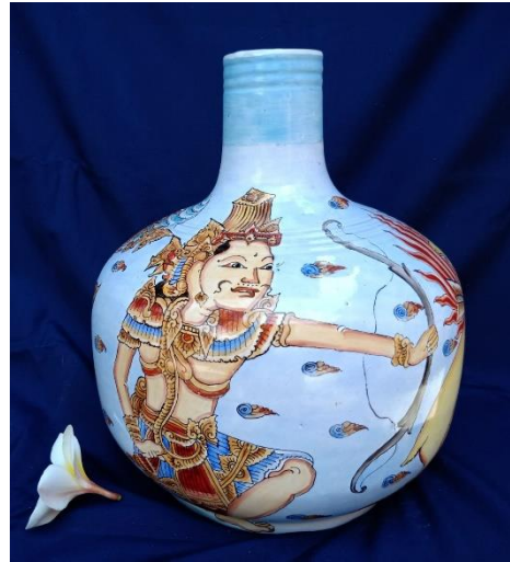
Gambar 7. Rama Vase