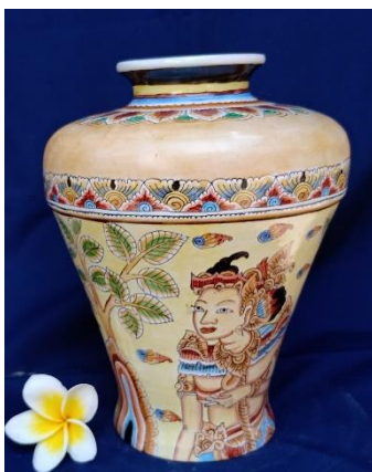
Gambar 12. Laksmana Jars