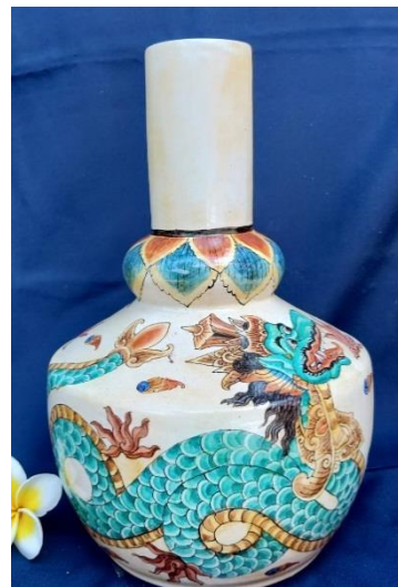
Gambar 8. Dragon Vase