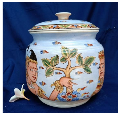
Gambar 3. Sangku Laksmana