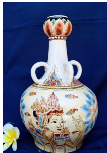
Gambar 9. Rama Vase 2