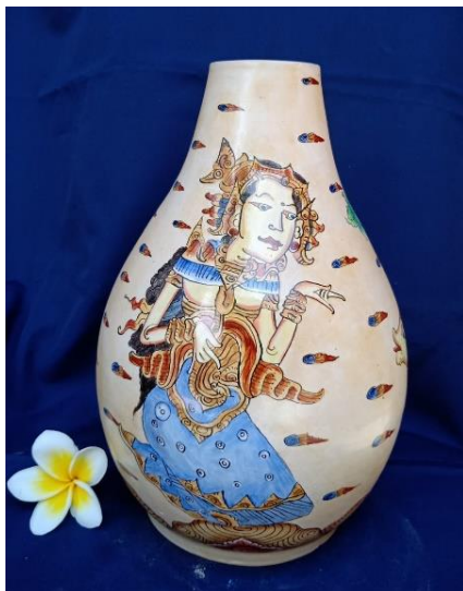
Gambar 6. Sinta Vase