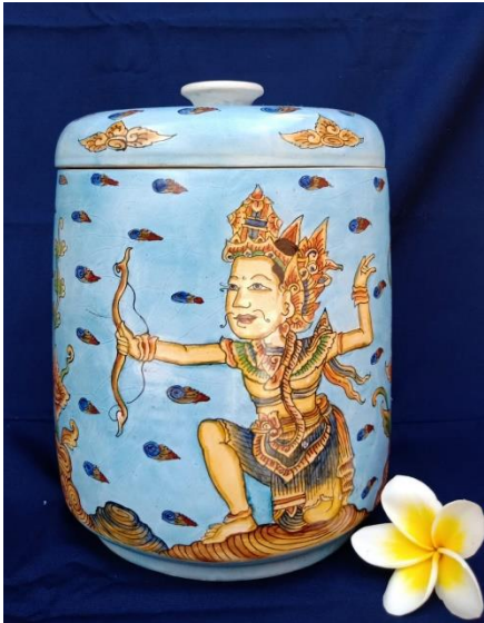
Gambar 4. Rama Cylinder