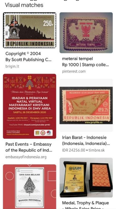
Gambar 11. Hasil pelacakan menggunakan google lens