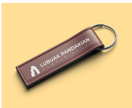
Gambar 14 Gantungan kunci/tas (Dokumentasi tim penelitian)

setiap orang memiliki objek sebagai gantungan ini, seperti tas, kunci, dll. Jenis ini juga lebih dibutuhkan dengan segmen yang sangat luas, mulai anak-anak sampai remaja. Bahan yang digunakan disesuaikan dengan nilai jualnya, untuk nilai jual menengah ke bawah menggunakan bahan kulit sintetis, sedangkan untuk kalangan menengah ke atas menggunakan bahan baku kulit tersama. Untuk warna yang digunakan akan di random, (coklat, hitam dan abu-abu).