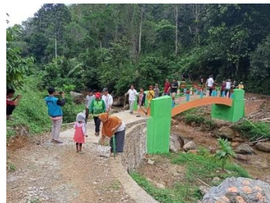
Gambar 1. Imprastruktur berupa akses jalan menuju lokasi objek wisata Lubuak pandakian (Dokumentasi Nagari Sumpur Kudus 2021)

Era globalisasi saat ini, kegiatan wisata menjadi salah satu kebutuhan di dalam kehidupan manusia, pariwisata merupakan salah satu sektor yang diandalkan pemerintah untuk memperoleh devisa dari penghasilan non-migas. Salah satu tempat wisata budaya indonesia yang sudah dikenal sejak dulu adalah danau toba, kabupaten samosir tunjuck melalui UU no. 36/2003 ditempatkan sebagai salah satu pariwisata yang paling diandalkan. Salah satunya wisata budaya tomok yang terletak di kecamatan simanindo kabupaten samosir yang merupakan salah satu objek wisata budaya yang sering di kunjungi wisatawan lokal maupun mancanegara.(Sitohang et al., 2019)