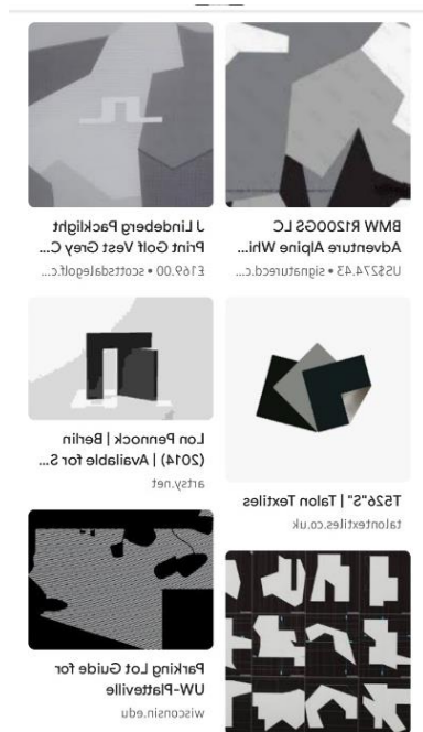
Gambar 8. Hasil pelacakan tidak terindikasi ada kemiripan dengan desain lain