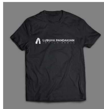
Gambar 19. Rancangan pada baju/kaos

Rancangan ke delapan merupakan implementasi desain dalam bentuk kaos/baju, media ini digunakan sebagai upaya untuk memnyuguhkan alternatif souvenir yang bisa digunakan sebagai pakaian, untuk warna dan ukuran disesuaikan dengan animo pembeli, pada aplikasinya nanti akan menggunakan Teknik hotprint, dimana kaos tersebut akan dibuat berdasarkan pesanan, dan bisa dikombinasikan dengan photo pemesan dengan latar belakang objek wisata Lubuak pandakian . Pada desain ini masih menampilkan siluet air terjun dan tulisan Lubuak pandakian .