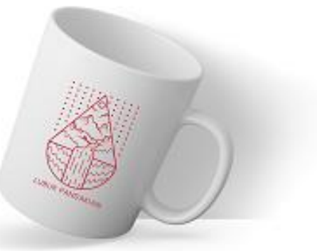
Gambar 17. Rancangan Mug