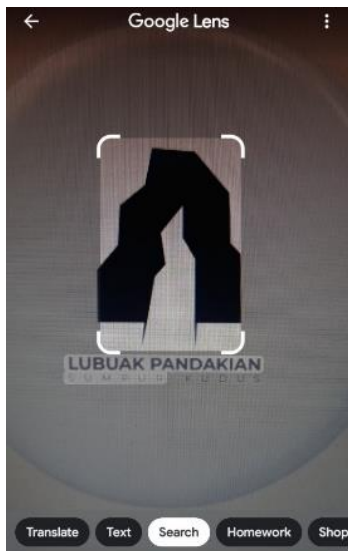
Gambar 7. Pelacakan menggunakan google lens