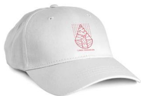
Gambar 20. Rancangan Topi

Topi merupakan asesories yang biasa digunakan oleh kaum laki-laki dan berguna untuk menutupi kepala dari matahari dan hujan, pada perancangan ini diharapkan souvenir tersebut bisa diminati oleh pengunjung mengingat lokasi wisata tersebut memiliki cuaca yang cukup panas sehingga membutuhkan alat perlindungan diri berupa topi, juga akan di buat dalam berbagai ukuran dan warna sehingga pengunjung memiliki pilihan yang banyak.