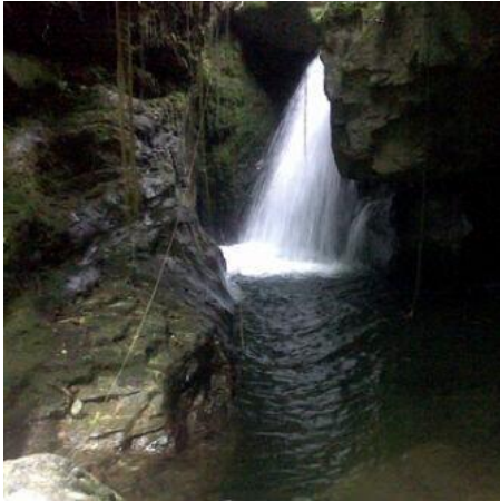
Gambar 5. Air terjun di photo dari sudut lain