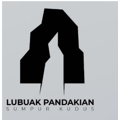
Gambar 6. Rancangan 1