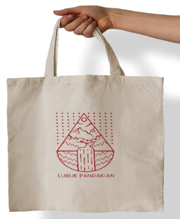
Gambar 16. Rancangan Totebag (Dokumentasi tim penelitian)