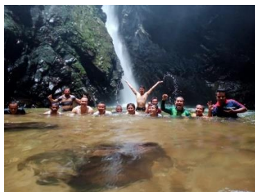
Gambar 2. Objek wisata air terjun Lubuak pandakian (Dokumentasi Nagari Sumpur Kudus 2021)

diharapkan selain menjadi oleh-oleh juga menjadi sarana promosi bagi tempat tersebut. (wawancara wali Nagari Sumpur Kudus).