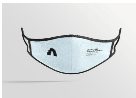
Gambar 15. Rancangan masker (Dokumentasi tim penelitian)

Sehubungan dengan dalam kondisi pandemic vovid-19, sebagai bentuk kepedulian juga merancang masker dengan ikon air terjun Lubuak pandakian , diharapkan selain sebagai oleh-oleh khas juga sebagai penlindung diri dari wabah covid 19, di buat menggunakan multi size (anak-anak, remaja dan dewasa).