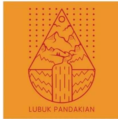
Gambar 9. Rancangan ke dua