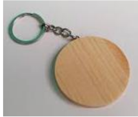
Gambar 18. Rancangan gantungan kunci bahan kayu

Salah satu potensi daerah yang berada di sekitar objek wisata adalah melimpahnya bamboo dan kayu, untuk memaksimalkan penggunaan bahan baku maka digunakan juga bahan-bahan yang berada dilingkungan sekitar, selain ramah lingkungan juga akan memiliki efek domino bagi perekonomian masyarakat sekitarnya.