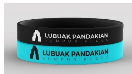
Gambar 13. Rancangan gelang rubber

Rancangan kedua berupa gelang rubber, dengan aplikasi tulan pada sekeliling gelang tersebut, juga ditambahkan siluet ikon air terjun Lubuak pandakian , gelang jenis ini dipilih selain segi visualnya menawan, biaya produksi tidak terlalu tinggi sehingga nilai jualpun lebih terjangkau, Adapun segmennya adalah untuk pengunjung remaja dan anak-anak, diharapkan akan diminati oleh kalangan tersebut, dampaknya bagi objek wisata akan semakin di kenal dikalangan remaja.