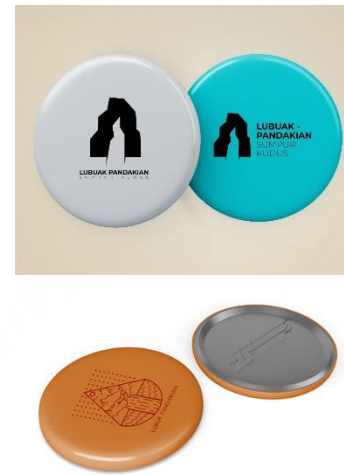
Gambar 12. Rancangan pin (Dokumentasi tim penelitian)

Rancangan pertama berupa pin biasanya di pake / ditempel pada kaos/ baju, desain yang diaplikasikan berupa gambar siluet dari air terjun Lubuak pandakian , pin ini terdiri beberapa ukuran sesuai dengan animo pengunjung, dan akan diperbanyak sesuai requestnya, Adapun segmennya yaitu untuk kalangan anak, remaja, dan dewasa.