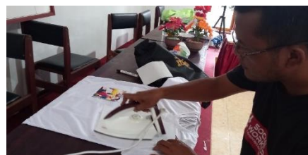
Gambar 3 Peserta pelatihan sedang memindahkan gambar pada kaos dengan menggunakan papper transfer pemindahan gambarnya dengan Teknik hotprint atau di setrika

Rencana penelitian ini juga merupakan lanjutan dari kegiatan sebelumnya yaitu program nagari binaan yang di fasilitasi oleh LPPMPP, dimana salah satu materi pelatihan tersebut adalah pembuatan souvenir dengan objek pelatihan adalah bagaimana memindahkan objek wisata Lubuak pandakian ke dalam Media kaos dengan Teknik digital printing dan aplikasi pada kaos menggunakan papper transfer Adapun objek gambarnya potensi wisata Lubuak pandakian , animo peserta pun sangat tinggi dengan produk yang telah dihasilkan walaupun dengan Teknik sederhana dan berkeinginan untuk lebih mengembangkan lagi dengan bentuk souvenir lainnya sehingga akan menjadi symbol dan media promosi bagi objek wisata tersebut.