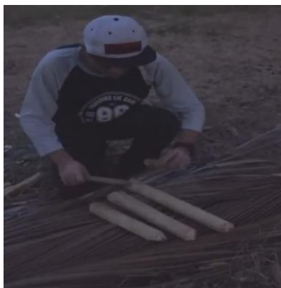
Gambar 1. Kolintang 3 Bilah

Seiring berjalannya waktu, kedua kaki ini diganti dengan dua batang pisang atau bisa diganti dengan tali seperti Arumba dari Jawa Barat. Dari tiga bilah kayu ini maka muncullah kata Kolintang yang berasal dari bunyi : Tong (Nada Rendah), Ting (nada tinggi), dan Tang (nada tengah). Kata ini sering digunakan oleh masyarakat Minahasa untuk mengajak bermain kolintang : “Mari kita ber Tong Ting Tang” dalam bahasa lain “Maimo Kumolintang” dari kebiasaan inilah makanya muncul nama “Kolintang” dan nama ini telah menyebar luas ke berbagai daerah.