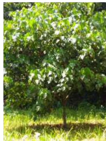
Gambar 5. Pohon Kayu Wanderan