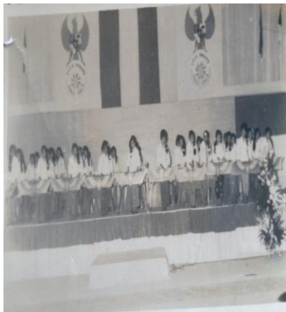
Gambar 9. Kolintang di Istana Negara