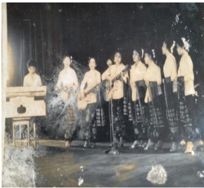
Gambar 8. Orkes Kolintang