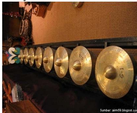
Gambar 2. Alat musik gong sebagai kegiatan ritual keagamaan di Minahasa.

Pada saat agama Kristen masuk ke Minahasa, musik kolintang dianggap kafir dan akhirnya dilarang untuk dimainkan. Sebagai gantinya muncul alat musik logam (gong) yang didatangkan dari luar daerah, kolintang gong dimainkan dalam berbagai acara adat menggantikan kolintang kayu (Astuti, Arso, and Wigati 2015, 34). Bahkan pada eksekusi hukuman adat “Tumoktok tou”, setiap bunyi ketukan kolintang diiringi oleh ayunan pedang sang algojo (Graafland 1898). Namun karena alat musik gong berfungsi sebagai barang pusaka yang turun temurun dapat diwariskan, keberadaannya mulai terancam.