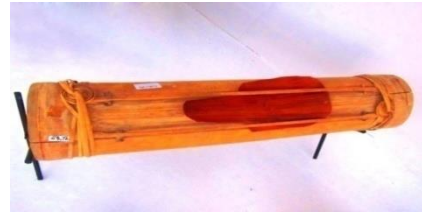
Gambar 4. Alat musik tetengkoran

Namun bebunyian ini tidak digunakan lagi setelah masuknya ajaran gereja Kristen di desa Lembean, dan digantikan dengan hentakan kaki pada lantai atau tempat di mana upacara diadakan dan karena Kepala Desa (Tunduan) adalah figur yang memiliki pamor, biasanya memiliki rumah panggung yang saat ini kita sebut rumah adat Minahasa.