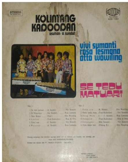
Gambar 11. Grup Kolintang Kadoodan