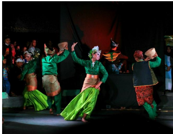
Gambar 2. Penampilan Teater Cerita Rakyat Paloh Naga

Gambar 2 menunjukkan implemmentasi kegiatan teater cerita rakyat paloh naga oleh peserta didik dan tutor PKBM Sanggar Lingkaran. Kegiatan ini menunjukkan peserta didik terlibat langsung dalam pementasan cerita rakyat Paloh Naga, pembacaan pantun dan syair Melayu, serta aktivitas ekspresi seni di lingkungan Agrowisata Paloh Naga. Hal ini, tidak hanya memperlihatkan keterlibatan aktif peserta didik dalam proses belajar, tetapi juga menegaskan bahwa folklor lisan telah menjadi media pembelajaran yang hidup dan kontekstual. Dengan demikian, pembelajaran folklor lisan di PKBM Sanggar Lingkaran tidak berhenti pada tataran pengetahuan, tetapi bertransformasi menjadi pengalaman belajar autentik yang membentuk karakter, identitas budaya, dan keterampilan abad ke-21 peserta didik.