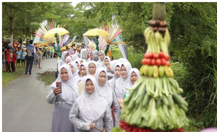
Gambar 5. Kegiatan Kenduri Sawah

Pada aspek ritual dan upacara adat, keterlibatan peserta didik PKBM Sanggar Lingkaran dalam kegiatan adat Desa Denai Lama berupa kenduri sawah. Kenduri sawah merupakan bentuk kearifan lokal masyarakat agraris yang diwujudkan melalui kegiatan syukuran setelah panen. Tradisi ini dilakukan dengan cara berkumpul bersama warga sebagai ungkapan rasa syukur kepada Tuhan atas hasil panen yang diperoleh, sekaligus memohon keberkahan, keselamatan, dan keberlanjutan usaha tani di masa mendatang. Kenduri sawah juga berfungsi sebagai sarana memperlancar hubungan sosial, memperkuat solidaritas, serta menjaga nilai-nilai kebersamaan dan gotong royong yang telah diwariskan secara turun-temurun dalam kehidupan masyarakat pedesaan (Rozaita et al., 2016).