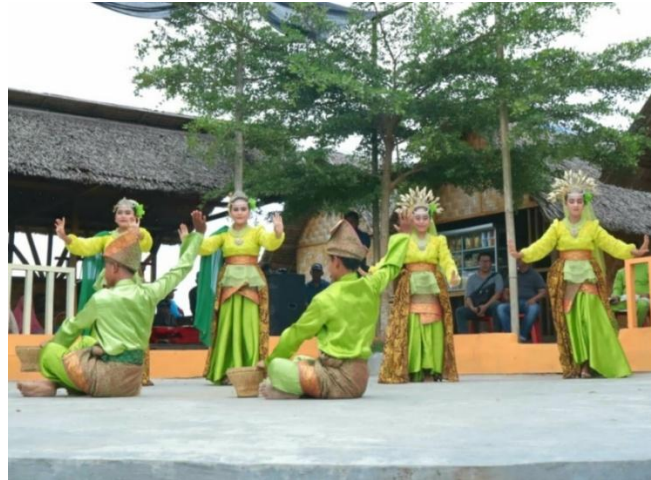
Gambar 3. Penampilan Tari Tradisional PKBM Sanggar Lingkaran

meningkatkan kepercayaan diri, kemampuan komunikasi, dan empati peserta didik melalui kerja kelompok dan ekspresi gerak. Pemahaman peserta didik PKBM Sanggar Lingkaran terhadap makna simbolik, nilai filosofis, dan konteks sosial tarian juga sejalan dengan temuan Lobo et al. (2025) yang menegaskan bahwa pembelajaran tari tradisional berperan penting dalam pelestarian warisan budaya dan pembentukan identitas kolektif. Keragaman tarian yang dipelajari mencerminkan realitas multikultural di sekitar PKBM dan berkontribusi pada penguatan sikap saling menghargai serta kebinekaan. Berikut merupakan gambar yang menunjukkan tari dari PKBM Sanggar Lingkaran.