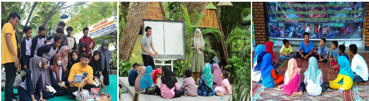
Gambar 6. Aktivitas Pembelajaran di PKBM Sanggar Lingkaran

Dengan demikian, pembelajaran folklor bukan lisan di PKBM Sanggar Lingkaran memperlihatkan kesesuaian yang kuat dengan hasil-hasil penelitian internasional dan nasional tentang peran pakaian adat dan makanan tradisional dalam pendidikan. Integrasi unsur budaya material dengan aktivitas wisata dan ekonomi kreatif berbasis komunitas membuktikan bahwa pendidikan nonformal mampu berkontribusi strategis dalam pelestarian budaya, penguatan identitas lokal, serta pengembangan keterampilan sosial dan kewirausahaan peserta didik. Dengan demikian, folklor bukan lisan tidak hanya berfungsi sebagai objek pembelajaran budaya, tetapi juga sebagai sarana efektif untuk membangun karakter, kesadaran budaya, dan partisipasi aktif peserta didik dalam pembangunan desa wisata yang berkelanjutan.