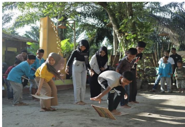
Gambar 4. Pembelajaran Melalui Permainan Tradisional

Selain tari, permainan tradisional yang diintegrasikan dalam pembelajaran folklor sebagian lisan di PKBM Sanggar Lingkaran—seperti egrang, layangan, dan terompah—memiliki kesesuaian kuat dengan temuan penelitian tentang peran permainan tradisional dalam pengembangan holistik peserta didik. Lathifah et al. (2025) menunjukkan bahwa permainan tradisional efektif dalam mengembangkan keterampilan sosial seperti kerja sama, berbagi, dan penyelesaian konflik. Sementara itu, Taneri et al. (2016) menegaskan bahwa permainan tradisional berkontribusi pada peningkatan kemampuan motorik, koordinasi, dan kreativitas. Nilai sportivitas, kebersamaan, dan solidaritas yang tumbuh melalui permainan di PKBM Sanggar Lingkaran juga sejalan dengan temuan Quiroz Sagardia (2025) yang menyatakan bahwa permainan tradisional berperan sebagai medium pewarisan budaya dan pembentukan identitas sosial. Berikut gambar yang menunjukkan kegiatan pembelajaran melalui permainan tradisional di PKBM Sanggar Lingkaran.