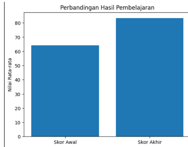
Gambar 2. Perbandingan Hasil Pembelajaran

Peningkatan pada aspek ketepatan penerjemahan juga menunjukkan bahwa siswa tidak hanya mampu memahami makna leksikal, tetapi mulai memperhatikan konteks dan relasi interpersonal dalam teks. Sementara itu, peningkatan pada pemahaman struktur klausa menunjukkan bahwa penggunaan parikan sebagai media pembelajaran membantu siswa mengenali unsur-unsur gramatikal secara lebih konkret seperti pada gambar di bawah ini.