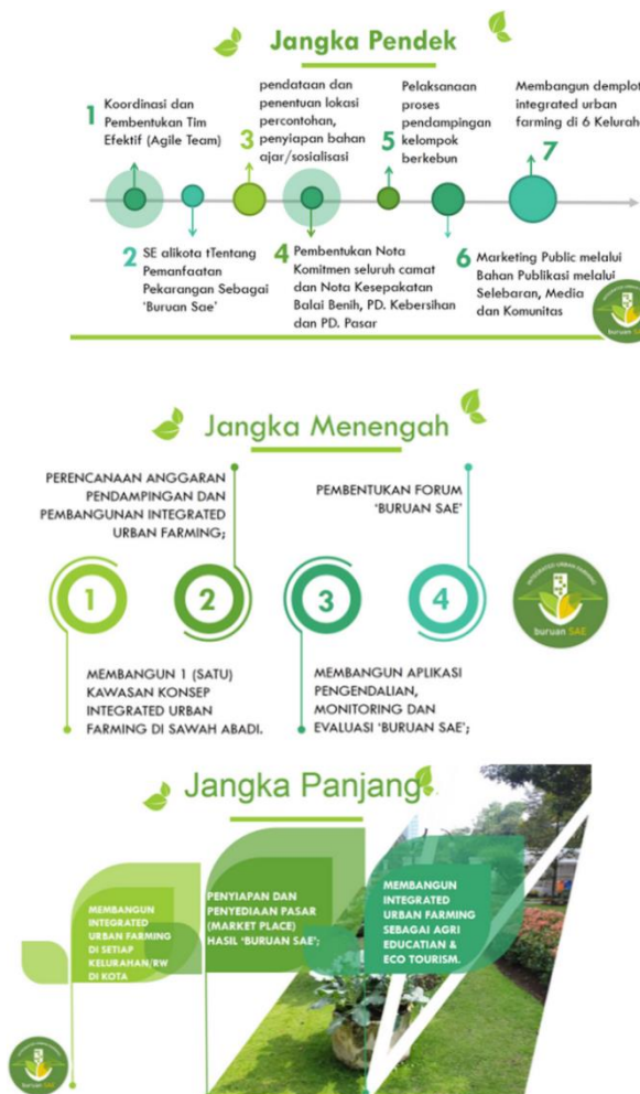
Gambar 1. Tahapan Buruan SAE

Buruan SAE dari DKPP termasuk ke dalam wujud pemberdayaan atau pengembangan masyarakat karena program ini mendorong masyarakat untuk melakukan aksi kolektif untuk mencapai satu tujuan yang sama, yaitu ketahanan pangan pada tingkat keluarga. Namun dengan berbagai latar belakang sosial-budaya dan ekonomi yang ada di masyarakat, implementasi program Buruan SAE pada setiap daerah, dari proses sampai hasilnya, berbeda-beda antara satu kelompok dengan kelompok lainnya, dikarenakan belum adanya sarana terintegrasi yang memudahkan para komunitas untuk mengakses berbagai macam informasi serta layanan pemerintah melalui digital governance Buruan Sae yang terintegrasi antara semua stakeholders.