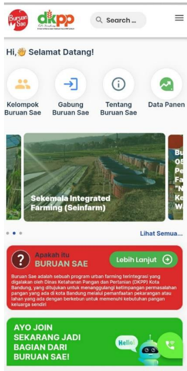
Gambar 4. web site Buruan Sae