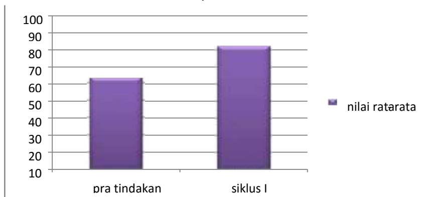
Gbr. 7. Diagram Batang Nilai Rata-Rata Pra Tindakan Dan Nilai Rata-Rata Siklus I

Dari hasil tersebut dapat dilihat pada diagram perbandingan nilai rata-rata siswa pada Pra Tindakan dan nilai rata-rata siswa siklus I disajikan di bawah ini.