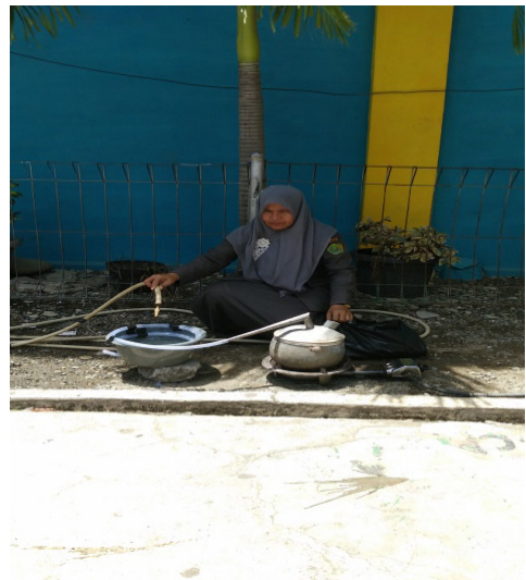
Gambar 7. Proses Pengisian Air Ke Dalam Ember Penampungan