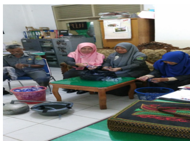
Gambar 3. Proses Persiapan Alat dan Bahan