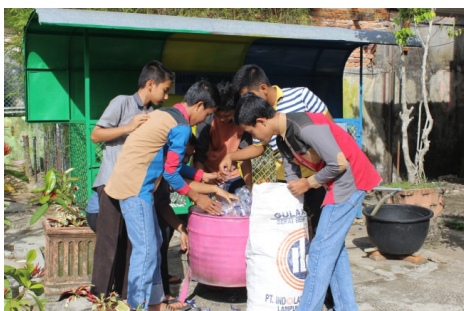
Gambar 2. Proses pengumpulan sampah plastik