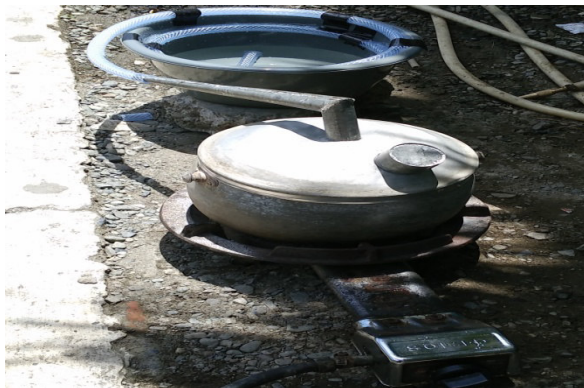
Gambar 5. Alat Pirolisis