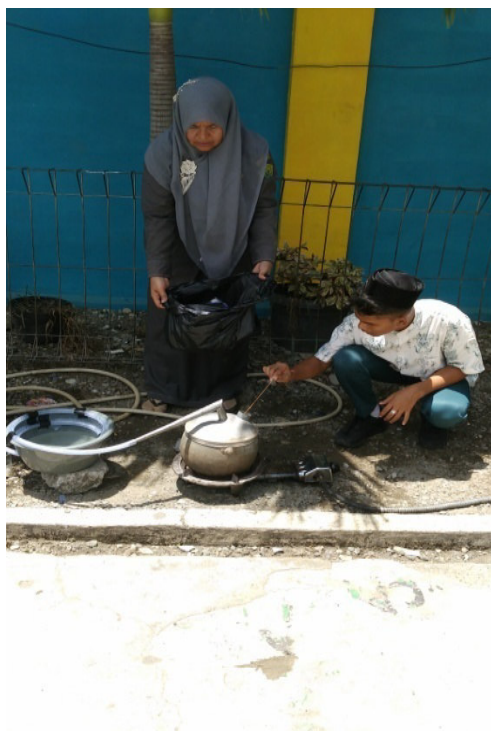
Gambar 8. Proses Memasukkan Plastik Ke Dalam Reaktor