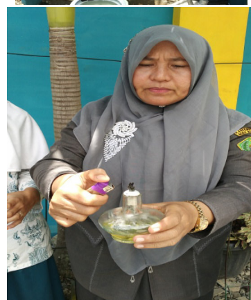
Gambar 10. Proses Percobaan Pada Lampu Teplak