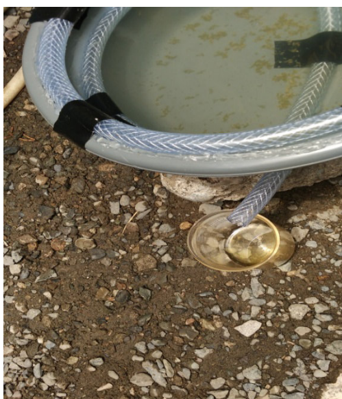
Gambar 9. Proses Ke Luarnya Minyak Dari Selang Menuju Ke Tempat Penampungan