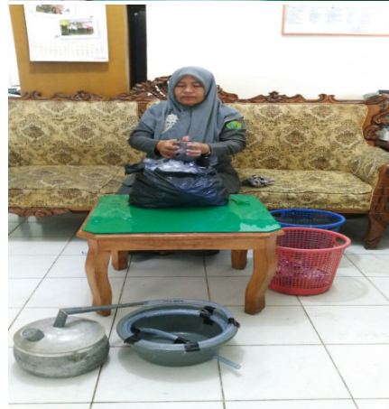
Gambar 6. Proses persiapan