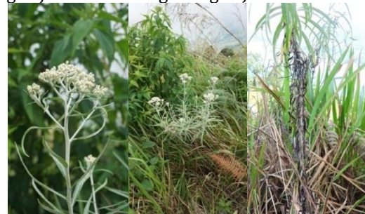
Gambar 2. Tumbuhan Edelweis ( Anaphalis longifolia )

Jenis Edelweis yang di peroleh adalah Anaphalis longifolia (Blume) Blume ex DC. penentuan jenis edelweis ini mengacu pada buku Van Steenis dengan judul Flora Pergunungan Jawa.