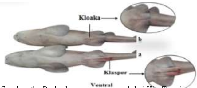
Gambar 1 : Perbedaan organ reproduksi Hiu Tupai ( Chiloscyllium hasselti ) jantan (a) dan betina (b)

Secara morfologi perbedaan antara Jantan dan Betina Hiu Tupai yaitu :