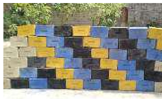
Gambar 4. Hasil Batu Bata Yang Sudah Kering