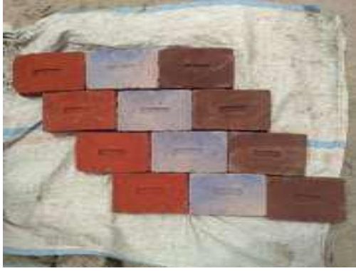
Gambar 5. Hasil Batu Bata Yang Sudah Dibakar Ke Tungku