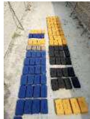
Gambar 2. Hasil Batu Bata Berwarna Setelah Di Cetak Dan Dijemur

Hasil tampilan atau bentuk dari pembuatan batu bata ini dapat dilihat di gambar 2, yaitu merupakan hasil cetakan yang bahannya sudah diaduk lalu dibuat secara manual dengan menggunakan cetakan batu bata sesuai dengan konsep atau desain yang di buat. Untuk ukuran batu bata sesuai dengan ukuran standar dan berdasarkan hasil survey maka hasil batu bata pencetakan secara manual lebih bagus dan bapat serta kuat dari pada hasil pencetakan menggunakan mesin. Hal ini sangat berbeda sekali dari bentuk dan kepadatan batu bata tersebut. Sesuai dengan dana yang didapat maka kami membutuhkan waktu yang lumayan lama untuk mencari kilang batu bata yang manual setelah beberapa pabrik yang kami survey. Karena sangat jarang sekali penggunaan pencetakan dengan manual karena kebanyakan pabrik/kilang tersebut sudah menggunakan mesin pencetak mengingat waktu dan pencetakan lebih cepat selesai, dan akan dilanjutkan setelah keringnya batu bata warna yang dijemur dengan pembakaran sehingga akan didapat hasil dan kesimpulan nantinya. Progress pekerjaan setelah batu bata dicetak dan dikeringkan mencapai persentase hingga 80%. Pekerjaan lanjutan yang akan dilakukan adalah pembakaran bata, dimana saat ini pembakaran telah mulai dilaksanakan dan hasil pembakaran akan didapat dalam kurun waktu 2 minggu.