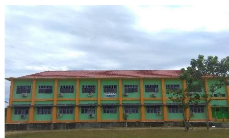
Gambar 2. Gedung F2

Jumlah Pengguna gedung adalah sebanyak 851 orang yang terdiri dari 14 orang staf, 22 dosen dan 815 mahasiswa. Penelitian ini bertujuan untuk mengetahui ketersediaan sistem proteksi kebakaran aktif dan pasif pada gedung Fakultas Kesehatan Masyarakat Universitas Teuku Umar berdasarkan Permen PU No:26/PRT/M/2008 tentang persyaratan teknis sistem proteksi kebakaran pada bangunan gedung dan lingkungan serta mengetahui tingkat keandalan gedung menurut Pd-T-11-2005-C yaitu pedoman pemeriksaan keselamatan bangunan gedung.