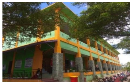
Gambar 1. Gedung F1

barang-barang atau arsip-arsip penting yang berpotensi menjadi sumber api apabila terjadi kebakaran. Gedung Fakultas Kesehatan Masyarakat dapat dilihat pada Gambar 1 dan 2 dibawah ini.