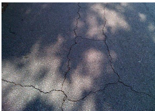
Gambar 2. Retak halus ( hair cracks )

Retak halus adalah retak yang terjadi mempunyai lebar celah \leq 3 mm. Sifat penyebarannya dapat setempat atau luas pada permukaan jalan.