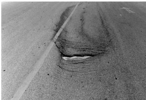
Gambar 8. Retak selip ( Slipage Cracks )

Kerusakan ini sering disebut dengan parabolic cracks , shear cracks , atau crescent shaped cracks . Bentuk retak lengkung menyerupai bulan sabit atau berbentuk seperti jejak mobil disertai dengan beberapa retak.