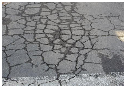
Gambar 3. Retak kulit buaya ( crocodile cracks )

Istilah lain adalah chickenwire cracks , alligator cracks , polygonal cracks , dan crazing . Lebar celah retak \geq 3 mm dan membentuk serangkaian kotak-kotak kecil yang menyerupai kulit buaya atau kawat untuk kandang ayam.