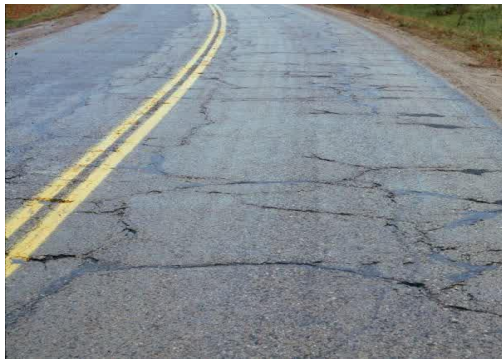
Gambar 6. Retak refleksi ( reflection cracks )