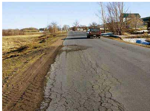
Gambar 4. Retak tepi ( edge cracks )

cracks ) dengan atau tanpa cabang yang mengarah ke bahu.