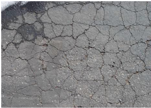
Gambar 7. Retak susut ( shrinkage cracks )

Retak yang terjadi tersebut saling bersambungan membentuk kotak besar dengan sudut tajam atau dapat dikatakan suatu interconnected cracks yang membentuk suatu seri blocks cracks .