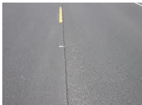
Gambar 5. Retak sambungan jalan ( lane joint cracks )

Sesuai dengan namanya retak ini terjadi pada sambungan dua jalur lalu lintas dan berbentuk retak memanjang ( longitudinal cracks ). Retak ini dapat terdiri atas beberapa celah yang saling sejajar.