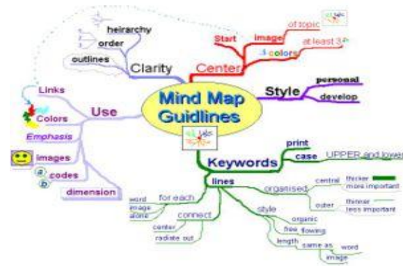
Gambar 1 Mind Map (Peta Berpikir)

Mind Map menurut Sutanto (2008:16) adalah suatu teknik grafis yang memungkinkan kita untuk mengeksplorasi seluruh kemampuan otak kita untuk keperluan berfikir dan belajar. Sedangkan menurut Sutanto (2008:2): “Whole Brain Thinking adalah suatu terobosan cara berpikir dengan memanfaatkan dua belahan otak secara sinergis. Mind mapping atau pemetaan pikiran merupakan salah satu teknik mencatat tinggi.” Informasi berupa materi pelajaran yang diterima siswa dapat diingat dengan bantuan catatan. Peta pikiran merupakan bentuk catatan yang tidak monoton karena Mind mapping memadukan fungsi kerja otak secara bersamaan dan saling berkaitan satu sama lain. Sehingga akan terjadi keseimbangan kerja kedua belahan otak. Otak dapat menerima informasi berupa gambar, simbol, citra, musik dan lain-lain yang berhubungan dengan fungsi kerja otak kanan.