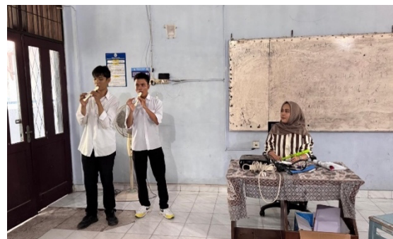
Gambar 4. Kelompok Mahasiswa Mempresentasikan Karya Hasil Revisi

Pada fase revisi hasil refleksi dan diskusi pada fase respon, setiap kelompok kemudian melakukan revisi terhadap karya ensambel musik mereka. Proses revisi ini mencakup perbaikan aspek teknis (ritme, tempo, harmonisasi) maupun aspek artistik (ekspresi, komunikasi musikal, dan kreativitas). Setelah revisi selesai, kelompok kembali mempresentasikan karya musik yang telah diperbarui di hadapan dosen dan rekan sejawat.