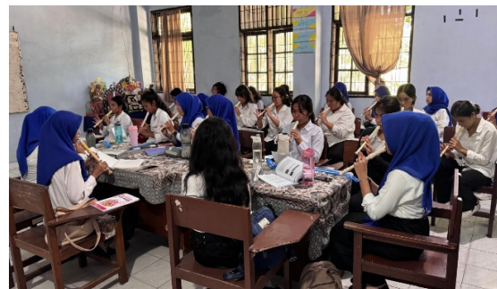
Gambar 3. Mahasiswa Berdiskusi Merevisi Karya Berdasarkan Masukan Kelompok Lain

Pada fase respon Setelah mendapatkan umpan balik dari kelompok lain, masing-masing kelompok kembali berdiskusi untuk menganalisis dan menafsirkan respon yang diterima.