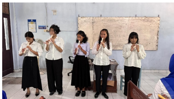
Gambar 2. Mahasiswa Mempresentasikan Hasil Karya Ensambel

Pada fase asesmen kolaboratif setiap kelompok mahasiswa mempresentasikan hasil karya pertunjukan ensambel musik yang telah mereka siapkan. Setelah pertunjukan berlangsung, kelompok lain memberikan umpan balik konstruktif berdasarkan indikator penilaian yang telah ditetapkan.