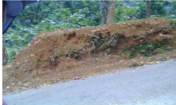
Gambar3. Timbunan Longsor Di Tepi Jalan Muaro Aia- Pancung Taba

dilakukan upaya konservasi akan menimbulkan bencana longsor seperti yang tergambar di bawah ini.