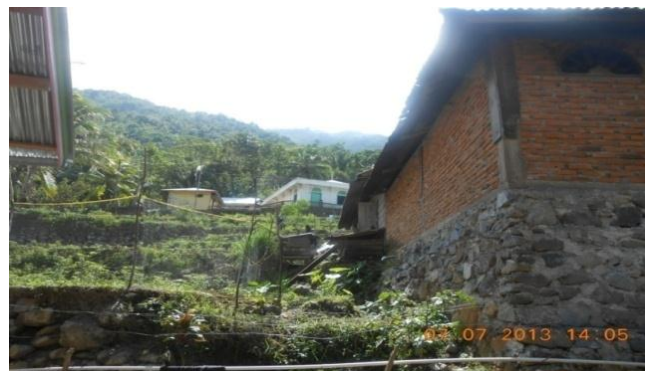
Gambar 2. Perubahan Tutupan Lahan Dari Hutan Alami Menjadi Pemukiman dan Kebun Campuran Di Kenagarian Koto Ranah

Perubahan tutupan lahan terbesar terjadi di Kenagarian Muaro Aia, dan Koto Ranah. Selain itu, pembangunan infrastruktur jalan maupun pemukiman yang memotong lereng sering ditemukan di Kenagarian Muaro Aia, Pancung Taba, dan Koto Ranah. Kenyataannya dapat dilihat pada gambar di bawah ini.