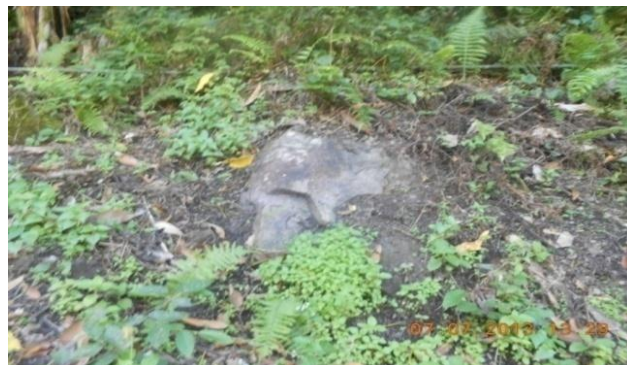
Gambar 4. Singkapan Batuan Pada Satuan Lahan Lereng Atas Perbukitan Vulkanis Berelereng Sangat Curam, Batuan Gunung Api, Jenis Tanah Kambisol Penggunaan Lahan Hutan Sekunder/Perkebunan (V5 V Qv Kam Hut Sek).

terlihat dengan ditemukannya beberapa singkapan batuan granit yang sudah mulai ditutupi vegetasi seperti pada gambar di bawah ini.