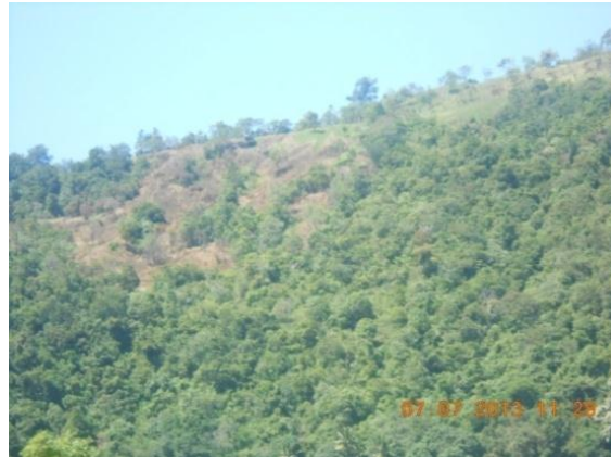
Gambar 1. Daerah Bertopografi Sangat Curam Pada Satuan Lahan Lereng Atas Pegunungan Vulkanik Berlereng Sangat Curam Tertutup Hutan Campuran Jenis Tanah Kambisol Batuan Intrusi Gunung Api

bergelombang perbedaan reliefnya kurang dari 10 meter. Daerah yang bertopografi curam dan sangat curam perbedaan ketinggian reliefnya 250m-615m, sebagaimana tercantum dalam gambar berikut: