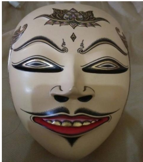
Gambar 5. Topeng Panji Asmarabangun

Situasi haru kembali terlihat ketika Panji bergerak seorang diri. Panji berdialog dengan tubuh tunggalnya, Ia bergerak dengan lembut dan bervolume sedang (penanda), sebagai (petanda) genre putra alus . Setiap adegannya, Panji tidak banyak berpindah pola lantai, Ia lebih banyak berekspresi di bagian tengah panggung (penanda). Pola lantai tersebut disesuaikan dengan konsepsi pembawaan Panji yakni rendah hati, sabar dan cerdas (denotasi).