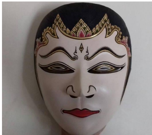
Gambar 2. Topeng Sekartaji

Karakter Sekartaji tidak hanya berhenti pada simbol tata rias busana saja, tetapi juga tampak pada perwujudan topeng yang dihadirkan. Topeng Sekartaji memiliki bentuk yang oval, terdapat hiasan di atas pangkal alis, alisnya tipis berwarna hitam, adapun warna yang mendominasi adalah putih. Terlihat pula warna merah pada bibir, emas sebagai ornamen dan warna hitam pada ujung sisi atas dan ujung kanan kiri. Ornamen yang paling menarik dari topeng Sekartaji ialah urna . Urna merupakan simbol mata ketiga (penanda) yang terletak pada bagian dahi. Urna dimaknai sebagai simbol Tri Netra . Tri Netra adalah istilah dalam bahasa Sanskerta yang berarti “tiga mata”. Istilah ini paling sering dikaitkan dengan Dewa Siwa (Shiva) dalam tradisi Hindu. Siwa digambarkan memiliki tiga mata: dua mata fisik dan satu mata spiritual yang berada di tengah kening (Sadewa et al., 2024).