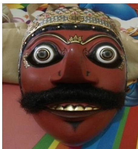
Gambar 4. Topeng Klana Sewandana

Tokoh Klana berbalut busana serba merah karena Klana adalah simbol keangkaramurkaan (penada). Sudah jelas bahwasanya dalam konsep Jawa Tokoh Klana digambarkan dengan alis bergaris tebal, mata bulat besar “ mbelolok ” dan hidung mancung mendongak (penanda) (Heriyawati, 2016). Warna merah pekat mendominasi seluruh celah wajah Klana (penanda), manyaratkan simbol keburukan. Tokoh Klana dihadirkan dalam Fragmen Tari Topeng Sekartaji sebagai perlambangan seseorang yang bertabiat buruk, serakah, penuh amarah dan tidak dapat mengendalikan hawa nafsu (denotasi) (Dana, 2014). Kedoknya sangat menyeramkan (petanda) mulutnya menganga disertai giginya yang menyeringai (penanda) bak orang tertawa terbahak-bahak (petanda) (Dana, 2014)