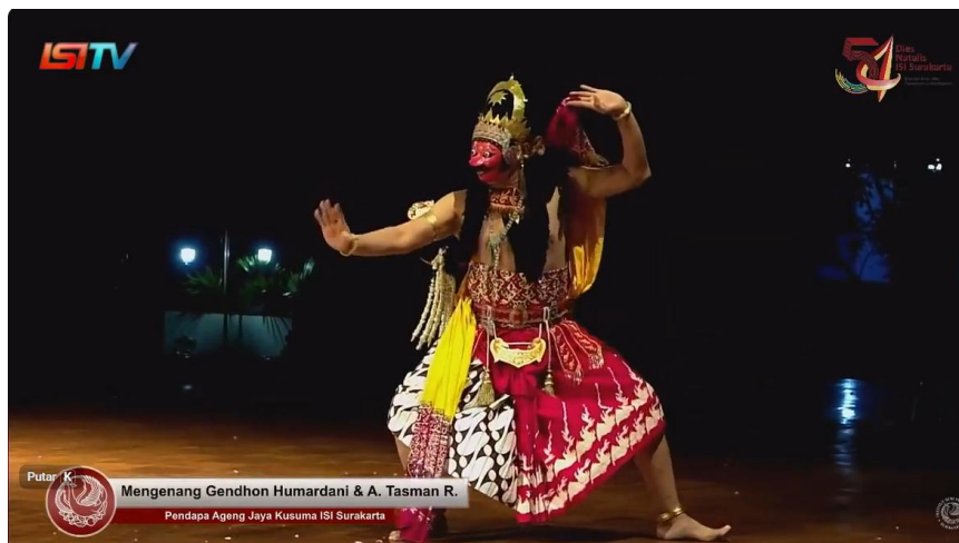
Gambar 3. Tokoh Klana Sewandana

Tokoh Klana berbalut busana serba merah karena Klana adalah simbol keangkaramurkaan (penada). Sudah jelas bahwasanya dalam konsep Jawa Tokoh Klana digambarkan dengan alis bergaris tebal, mata bulat besar “ mbelolok ” dan hidung mancung mendongak (penanda) (Heriyawati, 2016). Warna merah pekat mendominasi seluruh celah wajah Klana (penanda), manyaratkan simbol keburukan. Tokoh Klana dihadirkan dalam Fragmen Tari Topeng Sekartaji sebagai perlambangan seseorang yang bertabiat buruk, serakah, penuh amarah dan tidak dapat mengendalikan hawa nafsu (denotasi) (Dana, 2014). Kedoknya sangat menyeramkan (petanda) mulutnya menganga disertai giginya yang menyeringai (penanda) bak orang tertawa terbahak-bahak (petanda) (Dana, 2014)