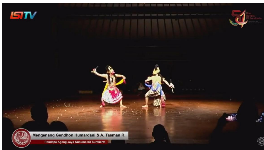
Gambar 6. Peperangan Panji dan Klana (Dokumentasi: Tangkapan Layar kanal Youtube UPT. Audio Visual ISI Surakarta, 17 Januari 2019)

Klana geram, Klana akhirnya menambah kekuatannya, untuk melakukan gerak menusuk kaki Panji, tetapi kegagalan kembali terulang, Panji dapat menghindari (petanda) melalui gerak srisik (penanda). Saat berperang melawan Klana, Panji tidak hanya mengandalkan otot tetapi juga taktik, walaupun Panji terlihat lebih bringas tetapi Ia berusaha untuk tetap tenang (petanda). Ketenangannya terlihat dari gerak yang dihadirkan yakni masih tetap banyu mili (penanda). Ungkapan gerak tersebut justru bertolak belakang dengan Klana, yang mana dalam pikiran dan hatinya, Klana ingin cepat-cepat membunuh Panji, agar dapat segera memperistri Sekartaji. Klana terlihat kalap (denotasi) dan tidak dapat berfikir tenang. Untuk mencapai tujuannya, Klana melanjutkan adu kekuatan. Pada babak ini Klana dan Panji berada pada satu garis lurus Panji membelakangi penonton dan Klana menghadap ke arah depan.