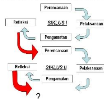
MODEL PENELITIAN TINDAKAN KELAS

Jenis dalam penelitian ini merupakan jenis penelitian tindakan kelas ( classroom action research ) yang dilaksanakan oleh guru di kelas. Penelitian tindakan kelas memiliki beberapa siklus, di mana setiap siklus diawali dengan rencana ( planning ), penerapan tindakan ( action ), observasi ( observation ) dan mengevaluasi dari suatu tindakan dalam proses belajar-mengajar, kemudian melakukan refleksi ( reflection ) dan seterusnya sampai perbaikan serta peningkatan yang diharapkan tercapai.