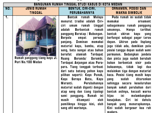
Tabel 1. Bangunan Rumah Tinggal Studi Kasus di Kota Medan