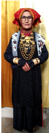
Gambar 1. Baju Kuruang Basiba Bundo Kandung pada Alek Gadang

kerbau. Baju kuruang basiba bundo kanduang yang digunakan pada alek gadang dapat dilihat pada gambar dibawah ini.