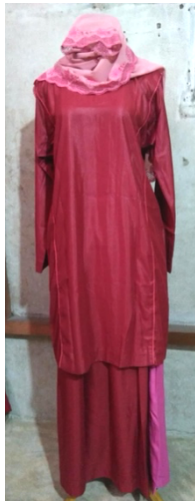
Gambar 3. Baju Kuruang Basiba Bundo Kanduung pada Alek Kaciak

Alek Kaciak merupakan tingkatan adat paling kecil. Alek kaciak atau acara kecil ini dilakukan lebih sederhana dari alek lainnya. Baju kuruang basiba bundo kanduang yang digunakan ketika mengadakan alek kaciak dapat dilihat pada gambar dibawah ini