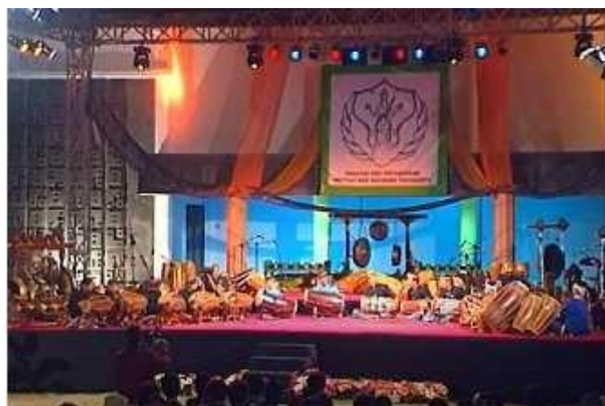
Gambar 2. Duel Kendhang, sebagai aplikasi konsep Wandali Dalam garapan Kendang