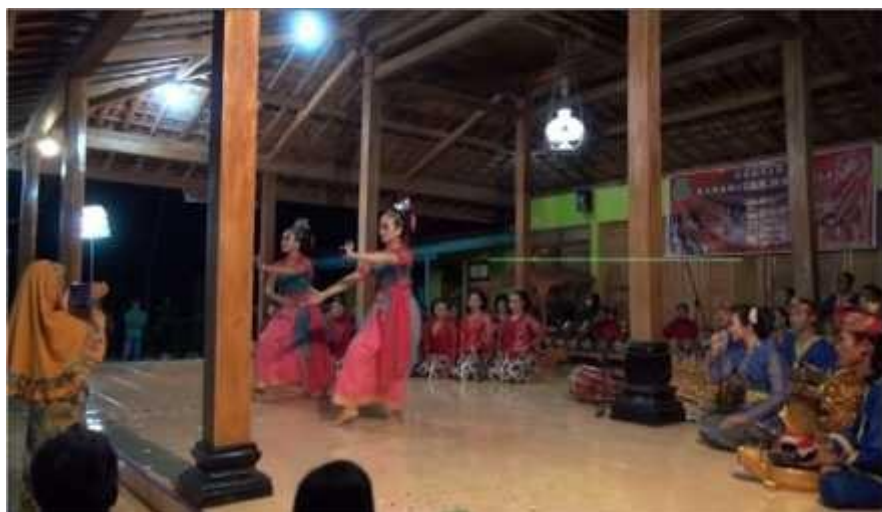
Gambar 3. Pentas Karawitan Jawa, Sunda, Bali beserta tarinya Dalam tajuk Wandali.

Wandali juga menjadi inspirasi untuk digunakan sebagai tema dalam pertunjukan. Hal ini seperti yang digagas oleh Jurusan Karawitan Fakultas Seni Pertunjukan ISI Yogyakarta pada tahun 2015. Pertunjukan ini dilaksanakan pada tanggal 24 – 26. November 2015 di Desa Budaya Bobung Putat Patuk Gunung Kidul Yogyakarta. iv Pergelaran ini bertajuk Gebyar Karawitan Wandali (Jawa, Sunda dan Bali) sukses digelar Jurusan Karawitan Fakultas Seni Pertunjukan Institut Seni Indonesia (ISI) Yogyakarta kerja sama dengan Desa Budaya Putat Patuk Gunung Kidul Pergelaran ini dalam rangka Pergelaran dan Diseminasi Seni Fakultas Seni Pertunjukan ISI Yogyakarta dengan mengambil tema Wandali. Adapun sajiannya terdiri dari beberapa karya tari dan karawitan yang meliputi karawitan dan tari Jawa, karawitan dan tari Sunda, juga karawitan dan tari Bali. v