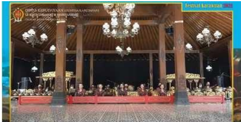
Gambar 1. Penyajian Gending Siskamling dalam Festival Karawitan Bantul, 2021