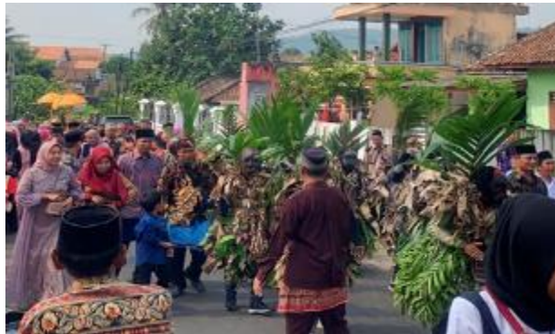
Gambar 9. Pendukung Arak-Arakan Rudat Keratuan Darah Putih

Pendukung merupakan keterlibatan masyarakat yang membantu jalannya kegiatan dari sajian kesenian Arakan-Arakan Rudat Keratuan Darah Putih Desa Kuripan Kabupaten Lampung Selatan. Terdapat beberapa pihak yang menjadi pendukung dalam melaksanakan kegiatan kesenian ini antara lain, Pemuda pemudi Desa Kuripan Kabupaten Lampung Selatan yang berperan sebagai pemain juga penonton yang ikut serta meramaikan kegiatan tersebut. Masyarakat setempat yang terdiri dari orang dewasa, anak-anak, baik pria maupun wanita turut ikut serta dalam meramaikan kegiatan tersebut. Anak-anak sanggar intan yang menjadi penari dalam Arak-Arakan Rudat, pemain musik Rudat yang terdiri kalangan muda hingga tua, kemudian terdapat panitia hajjat yang menentukan lokasi Arak-Arakan dan mengatur jalannya acara, dan yang paling penting tentunya pemilik hajjat.