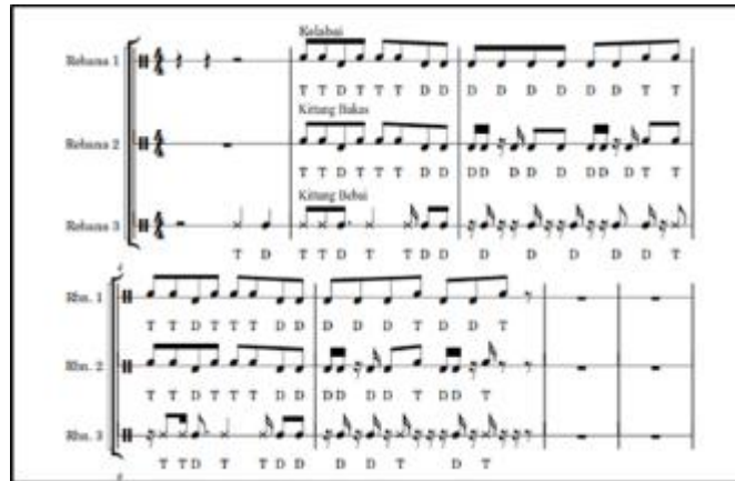
Gambar 2. Pola Tabuh Tikol Rudat Keratuan Darah Putih