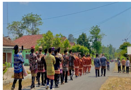
Gambar 8. Tempat Pertunjukan Rudat Keratuan Darah Putih di Jalan Raya