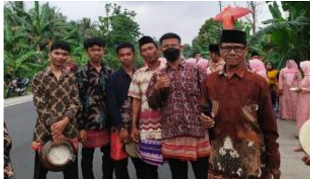
Gambar 10. Kostum Pemain Musik Rudat Keratuan Darah Putih