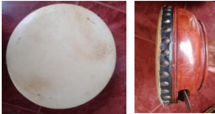
Gambar 1. Alat Musik Terbang/Terbangan Kuripan Keratuan Darah Putih

Kuripan Kabupaten Lampung Selatan ini menggunakan instrumen Rebana atau di Keratuan Darah Putih disebut sebagai Terbang/terbangan. Musik Arak-Arakan Rudat di Keratuan Darah Putih Desa Kuripan Kabupaten Lampung Selatan ini merupakan jenis alat musik Membranophone (kulit atau selaput tipis yang diregangkan sebagai penyebab bunyi) artinya sumber bunyinya berasal dari dari membran atau kulit dari alat musik tersebut.