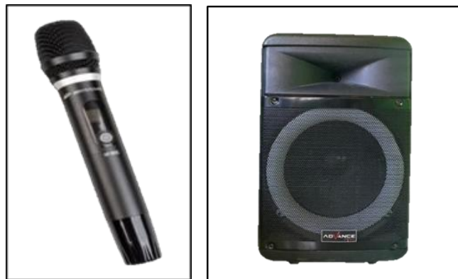
Gambar 11. Penguat Suara Vokal Inti Rudat Keratuan Darah Putih

Tata suara ( sound system ) merupakan sarana penyambung dari suara yang berfungsi sebagai penguat suara baik dari vokal atau iringan alat musik. Arak-Arakan Rudat di Keratuan Darah Putih Desa Kuripan Kabupaten Lampung Selatan ini menggunakan penguat suara berupa Speaker Bluetooth yang digunakan agar suara Hadi (vokal inti) dalam Arak-arakan suaranya terdengar jelas.