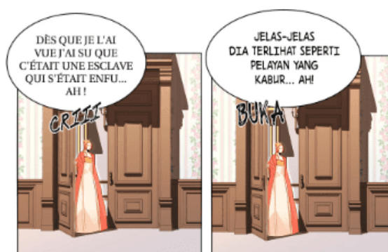
Image 3. Onomatopée crr et buka

Tiruan bunyi gerakan (bruit du mouvement). car il imite le bruit de l'ouverture d'une porte. La dernière différence présent dans la forme du mot, le mot crr crr est le résultat d'un processus de réduplication totale, tandis que le mot cklek est un seul mot ou une dérivation zéro.