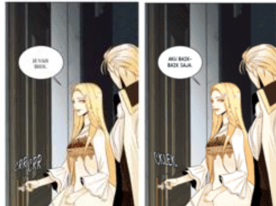
Image 2. Onomatopée crr crr et cklek

activités humaines quotidiennes, tandis que le mot Bruk est inclus dans la classification Tiruan bunyi gerakan (bruit du mouvement) car il imite le bruit d'une chute sur un canapé.