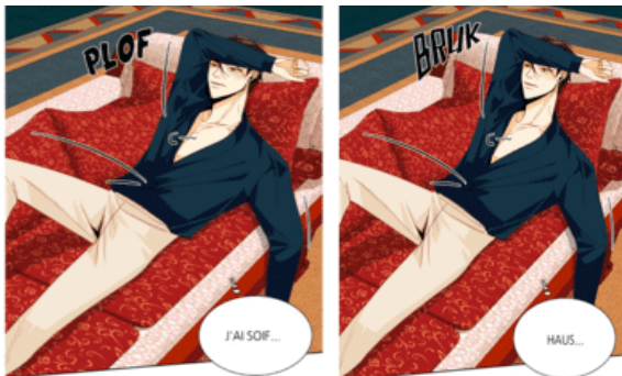
Image 1. Onomatopée plof et bruk

Voici les données sur bruit de la vie quotidienne :