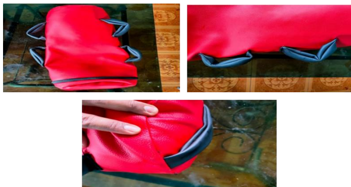
Gambar 3. Pegangan alat sebelum direvisi

Alat diciptakan dengan desain yang mudah dirawat serta efektif dan efisien digunakan dimana saja baik di luar ruangan maupun di dalam ruangan. Setelah melalui validasi para ahli, uji kelompok kecil dan uji kelompok besar maka evaluasi dilakukan pada pegangan alat dengan tujuan untuk memperkokoh pegangan agar alat dapat digunakan dalam jangka panjang dan tidak mudah rusak.