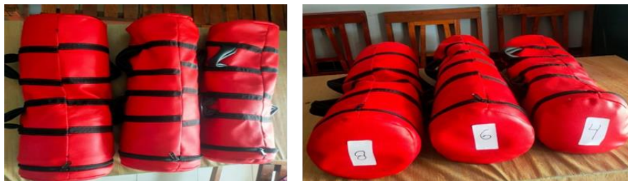
Gambar 5. Variasi berat Bag Power , 4 kg, 6 kg, dan 8 kg.

Bag Power didesain dalam beberapa variasi ukuran berat yakni 4 kilogram, 6 kilogram, dan 8 kilogram dengan tujuan memudahkan pengguna dalam menyesuaikan berat yang dibutuhkan saat latihan.