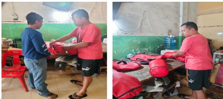
Gambar 4. Pengerjaan revisi pegangan alat