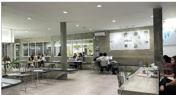
Gambar 2 Pencahayaan dan Tata Ruang Imadji Jempiring Coffee Shop ( indoor )

Gambar 2 menunjukkan memperlihatkan penerapan pencahayaan alami dan buatan yang memadai melalui bukaan jendela dan lampu langit-langit sehingga menciptakan kenyamanan visual bagi pengunjung. Selain itu, tata ruang yang fleksibel dengan konsep indoor , semi-indoor , dan outdoor serta pengaturan area duduk yang beragam memungkinkan pengunjung menyesuaikan pilihan ruang sesuai kebutuhan dan preferensi, baik untuk belajar, bekerja, maupun bersantai.