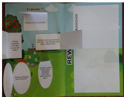
Gambar soal evaluasi dalam media lift the flap book tematik berbasis discovery learning