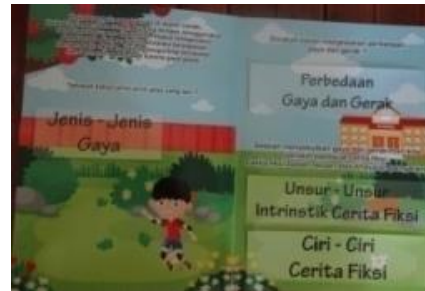
Gambar cara penggunaan media lift the flap book tematik