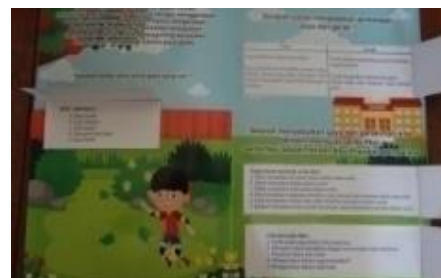
Gambar cara penggunaan media lift the flap book tematik berbasis discovery learning