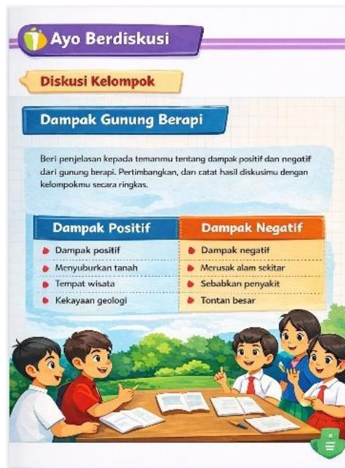
Gambar 5. Desain Isi Buku

Pada tahap Development (pengembangan) didapatkan hasil validasi buku ajar Bahasa Indonesia tematik integratif menunjukkan tingkat kelayakan yang sangat tinggi. Penilaian oleh ahli materi memperoleh skor rata-rata 92,4%, ahli bahasa sebesar 90,8%, dan ahli media sebesar 94,1%, dengan rata-rata keseluruhan 92,4% yang berada pada kategori sangat valid. Temuan ini menunjukkan bahwa isi materi telah sesuai dengan kompetensi dasar dan indikator pembelajaran, penggunaan bahasa komunikatif dan sesuai dengan karakteristik siswa kelas IV, serta tampilan visual yang mendukung keterbacaan dan ketertarikan siswa.