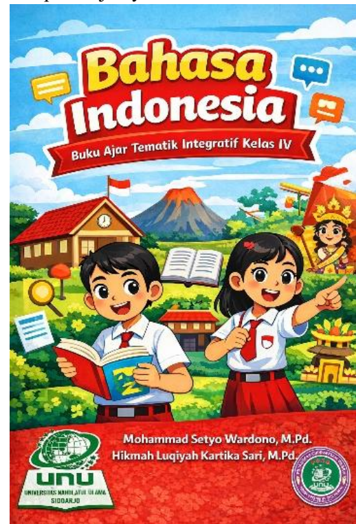
Gambar 3. Cover Buku

dirancang bersifat interaktif dan mendorong partisipasi aktif siswa. Hasil dari tahap desain ini berupa prototype buku ajar tematik integratif yang siap untuk dikembangkan dan divalidasi pada tahap selanjutnya.