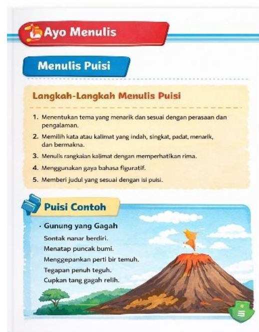
Gambar 4. Desain Isi Buku