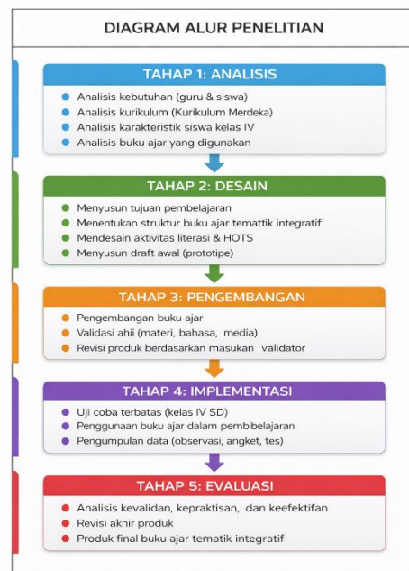
Gambar 2. Alur penelitian

Tahap desain mencakup perencanaan struktur dan sistematika buku ajar, pemetaan kompetensi dasar ke dalam indikator pembelajaran, penentuan tema dan subtema, serta perancangan aktivitas literasi yang mendukung keterampilan membaca, menulis, berbicara, dan menyimak. Selanjutnya, pada tahap pengembangan, draf buku ajar disusun secara lengkap meliputi materi, ilustrasi, latihan, dan evaluasi pembelajaran. Produk yang telah dikembangkan kemudian divalidasi oleh ahli materi, ahli bahasa, dan ahli media untuk menilai kelayakan isi, kebahasaan, dan tampilan buku ajar (Hidayat, R., Sari, 2024)