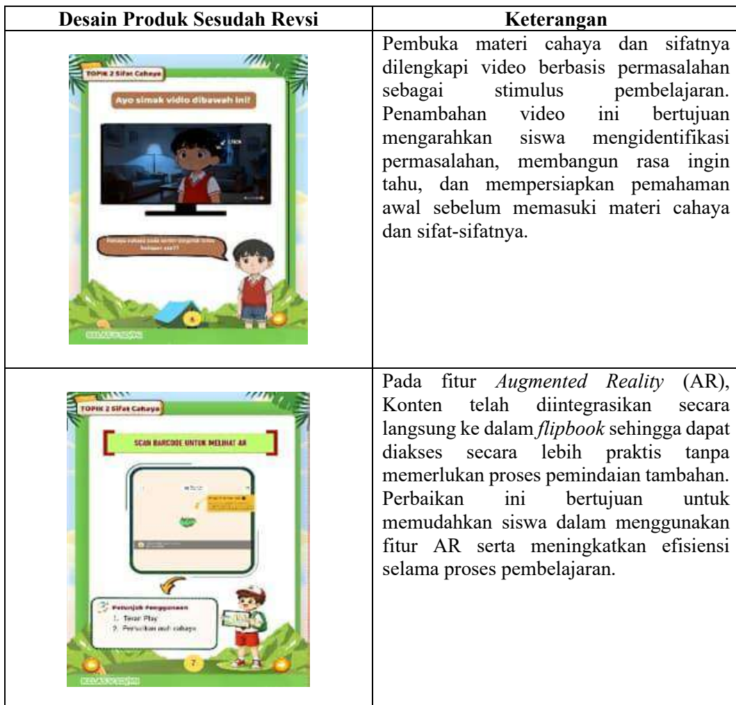
Tabel 4. Hasil Revisi Produk

Flipbook diakhiri dengan tahapan evaluasi yang dilanjutkan dengan revisi produk. Perbaikan dilakukan dengan mengacu pada masukan yang diperoleh dari para ahli selama tahap validasi. Desain media yang dikembangkan disajikan pada tabel berikut.