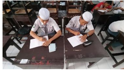
Gambar 2. Siswa Berlatih Menulis

Salah satu perkembangan yang terlihat dalam penelitian ini adalah meningkatnya penguasaan kosakata siswa yang menjadi dasar dalam melakukan komunikasi sederhana. Kosakata yang diperoleh melalui materi dan aktivitas pembelajaran membantu siswa memahami serta membentuk kalimat dalam Bahasa Jerman. Penguasaan kosakata memiliki peran penting karena kemampuan komunikasi sangat bergantung pada kemampuan seseorang dalam memahami dan menggunakan kata yang sesuai. Hal tersebut sejalan dengan (Uswar et al., 2023) menjelaskan bahwa penguasaan kosakata merupakan komponen penting dalam keterampilan komunikasi bahasa. Selain itu, perkembangan pelafalan dan penggunaan bahasa secara lisan menunjukkan bahwa lingkungan belajar yang memberikan kesempatan praktik dapat membantu siswa menyesuaikan diri dengan karakteristik bahasa yang dipelajari. (Hidayati et al., 2022) menjelaskan bahwa lingkungan pembelajaran bilingual dapat memberikan pengaruh terhadap perkembangan kemampuan bahasa, termasuk aspek pelafalan dan penggunaan bahasa siswa.