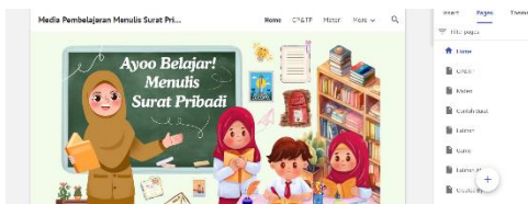
Gambar 8. Tampilan Awal Google Sites dan Navigasi Menu

Tahap development , rancangan desain diwujudkan ke dalam Google Sites melalui pemilihan tema, navigasi menu, dan penyematian tautan kode fitur.