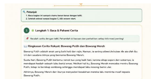
Gambar 4. Membaca Cerita Rakyat