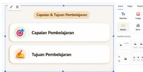
Gambar 9. Tampilan Menyematkan Tautan Kode Fitur

Produk yang dikembangkan kemudian melalui proses validasi ahli media pada delapan aspek menghasilkan persentase sebesar 95,18% di kategori sangat layak. Sementara validasi ahli materi menilai 7 aspek didapatkan skor persentase 96, 05% pada kategori sangat