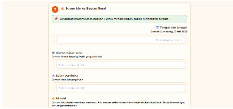
Gambar 6. Mengembangkan Gagasan