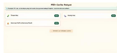
Gambar 3. Pemilihan Cerita Rakyat