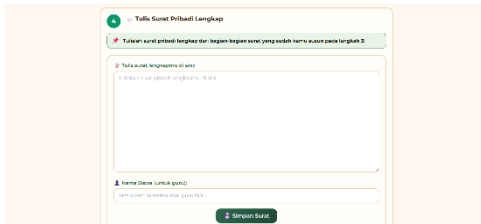
Gambar 7. Menulis Surat Pribadi Secara Utuh

Tahap development , rancangan desain diwujudkan ke dalam Google Sites melalui pemilihan tema, navigasi menu, dan penyematian tautan kode fitur.