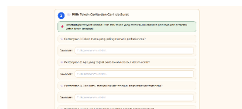
Gambar 5. Menjawab Pertanyaan Pemantik dari Cerita Rakyat