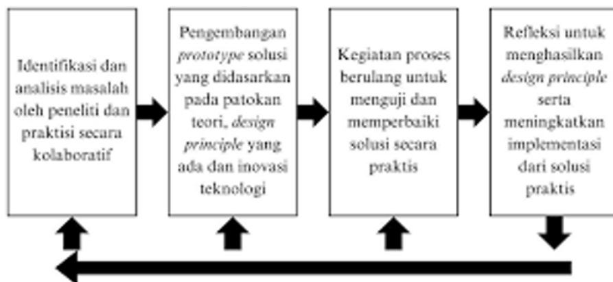
Gambar 1. Bagan Alur Penelitian Model Reeves

Proses pengembangan media komik digital merujuk pada model pengembangan ( Educational Design Research ) yaitu model generic karya McKenney & Reeves (2012) dengan menggunakan model berikut: