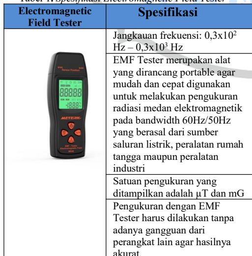
Tabel 1. Spesifikasi Electromagnetic Field Tester

Pengukuran dilakukan di 29 titik lokasi yang tersebar di kampus Universitas PGRI Yogyakarta. Setiap pengukuran di titik lokasi lima kali untuk melakukan kesalahan pengukuran. Alat yang digunakan dalam penelitian ini adalah Portable Electromagnetic Field Tester dengan spesifikasi seperti pada Tabel 1. berikut: