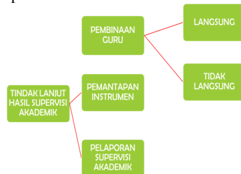
Gambar 2.4. Tindak Lanjut Supervisi Akademik

Berikut adalah bagan tindak lanjut supervisi akademik :