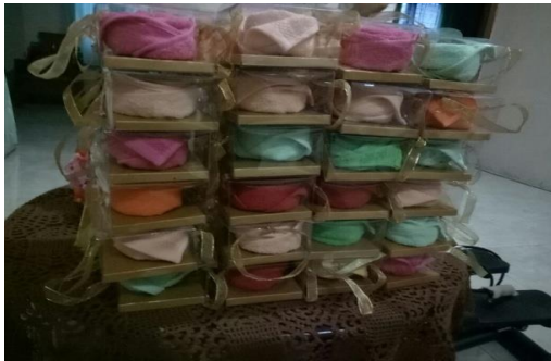
Gambar 3. Hasil kreatifitas modifikasi sapu tangan handuk menjadi bentuk produk pertanian yang siap diberikan ke tamu undangan