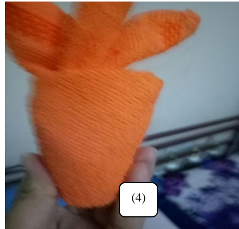
Gambar 2. (1) modifikasi buah peach; (2) modifikasi buah peer; (3) modifikasi nenas; dan (4) modifikasi wortel

Uji coba pengembangan usaha souvenir yang sudah dilakukan oleh ibu-ibu “Salimah” adalah membuat souvenir pernikahan untuk anggota keluarga “Salimah” yang melangsungkan pernikahan, seperti Gambar 3.