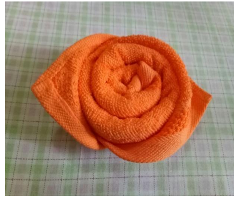
Gambar 1. Saputangan dalam bentuk modifikasi bunga mawar