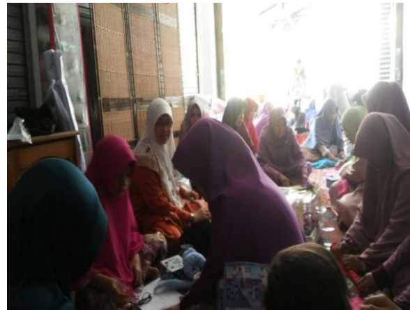
Gambar 2. Ketua Tim PKM sedang memberikan tutorial kepada peserta kegiatan

Peserta yang hadir adalah anggota Salimah yang tergabung dalam program “Sister” yaitu akronim dari Sekolah Ibu-ibu Salimah Terpadu, dimana kelompok ini bertugas untuk belajar dan hasil pembelajaran akan disosialisasikan ke anggota yang lain di kelompoknya masing-masing sesuai dengan RW yang diwakilinya