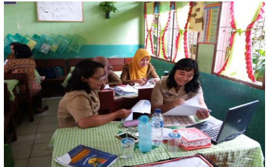
Gambar 3. Perumusan RPP dan Penilaian Otentik