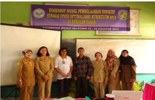
Gambar 2. Pendalaman Materi tentang Model Pembelajaran Inovatif