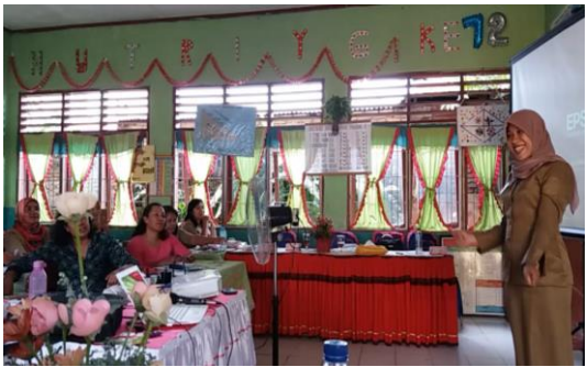
Gambar 5. Guru Model (Simulasi Pembelajaran)