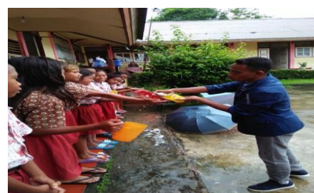
Gambar 3. Kegiatan Praktek Masal