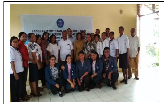
Gambar 4. Kegiatan Focus Discussion Group