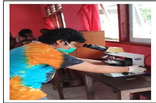
Gambar 5. Pemeriksaan Kecacingan

Hasil observasi menunjukkan bahwa peserta didik ketika bermain diluar rumah tidak menggunakan alas kaki, ditambah dengan lingkungan Desa Hatu yang banyak memiliki peliharaan anjing yang membuang kotoran sembarangan, kebersihan kuku tidak diperhatikan dengan baik, serta kurangnya kesadaran mencuci tangan pakai sabun. Pada anak infeksi kronis cacing gelang dapat menyebabkan kegagalan pertumbuhan akibat penurunan nafsu makan, terganggunya proses pencernaan dan malabsorpsi.