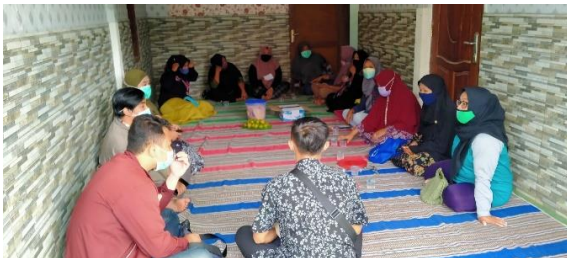
Gambar 1. Kegiatan Sosialisasi Potensi Pengolahan Komoditi Pertanian.

Sosialisasi dilakukan secara langsung kepada masyarakat sasaran di Kelurahan Merjosari RW 11, Kecamatan Lowokwaru, Malang pada tanggal 24 Agustus tahun 2021. Tujuan sosialisasi adalah menyampaikan program pengabdian masyarakat tentang potensi wilayah sasaran yaitu RW 11 Kelurahan Merjosari Kecamatan Lowokwaru Kota Malang dari komoditi pertanian yang diproduksi oleh kelompok tani “Kenangan Merjosari”. Potensi pengolahan pasca panen merupakan hal yang penting untuk disampaikan karena sebagai kegiatan yang dapat mendorong keberlanjutan agribisnis dan mencegah komoditi pertanian cepat rusak (Pitaloka, 2020).