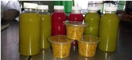
Gambar 2. Produk Pengolahan Pasca Panen.

Uji coba produk dilaksanakan di Laboratorium Home Agroindustri Model Program Studi Agribisnis Universitas Islam Malang. Tujuan uji coba produk adalah untuk mempersiapkan produk yang akan diproduksi pada wilayah sasaran. Produk yang diujicobakan adalah jus sayuran, jus buah dan abon lele. Produk-produk tersebut dipertimbangkan untuk diujicoba dengan pertimbangan bahwa bahan baku mudah diperoleh disekitar wilayah sasaran.