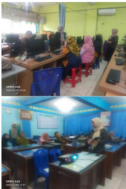
Gambar. Kegiatan Pendampingan Pengenalan Lab Matematika Virtual

diberikan dari kegiatan ini adalah pihak sekolah terutama guru matematika sangat senang dan antusias dengan pemberian Laboratorium Matematika Virtual. REspon penggunaan dari siswa juga lebih semangat belajar