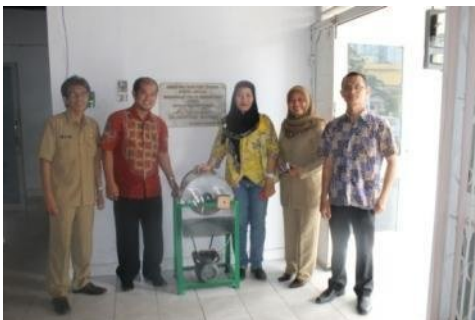
Gambar 3. Foto Saat Penyerahan Alat TTG

Rencana yang akan dilakukan ditahun berikutnya ialah membuat pusat Konsultasi tentang teknologi tepat guna serta melakukan pendampingan untuk melihat permasalahan mendasar tentang alat alat teknologi tepat guna yang dibutuhkan kelompok UPPKS, dan melibatkan kelompok UPPKS lebih banyak lagi dalam mengikuti pelatihan ini untuk lebih pemeratakan pengetahuan dan pemahaman tentang teknologi tepat guna bagi industri kecil yang tergabung dalam kelompok UPPKS yang dibina