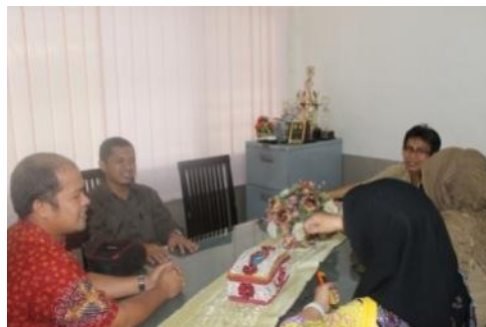
Gambar 1. Foto Lokasi Kegiatan Dan Saat FGD

Setelah kegiatan tim pengabdian pelatihan dan pendampingan kelompok usaha peningkatan pendapatan keluarga sejatera yang dilakukan diharapkan menjadi pencerahan dan masukan bagi kelompok usaha dan BkbbN untuk dapat melanjutkan kegiatan yang sama dalam rangka pembinaan kelompok uppks yang ada di KotaMedan . Keberlanjutan kegiatan ini sangat memungkinkan untuk dapat dilanjutkan karena para pelaku usaha kelompok uppks yang telah mengikuti pelatihan dan pendampingan dapat diberdayakan untuk kelompok usahanya. Selain itu juga diharapkan setelah pendampingan yang berkelanjutan LPM unimed juga mampu untuk mengambil peran strategis sebagai pusat Konsultasi teknologi tepat guna bagi UPPKS yang menjadi binaan LPM Unimed