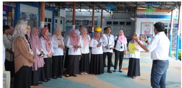
Gambar 3. Simulasi Early Warning System Bencana Gempa Bumi di Puskesmas Bantimurung