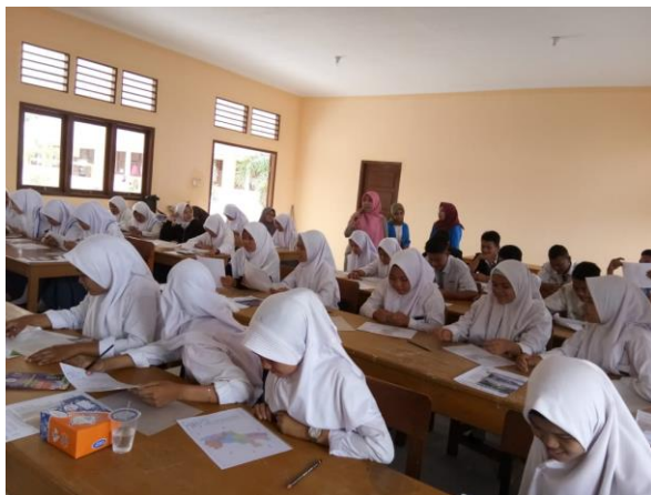
Gambar 1. Pemateri Memberi Penjelasan Tentang Konsep Seni Kartografi.

menginterpretasikan objek ke dalam simbol sangat minim.