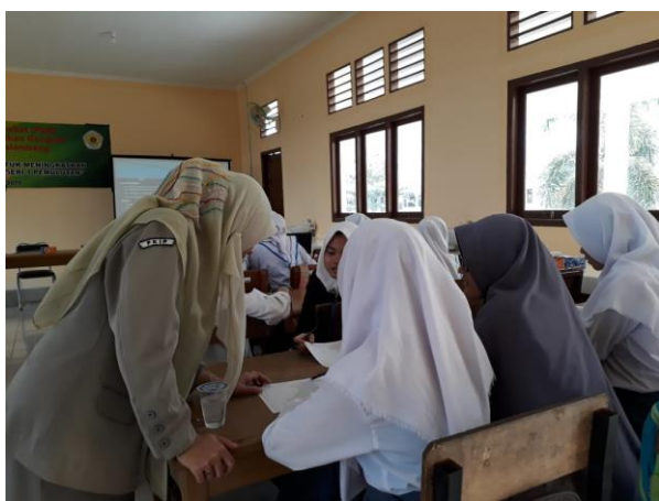
Gambar 2. Pendampingan Praktik Terbimbing.

Pada tahap akhir, siswa telah berhasil melakukan simbolisasi dengan kaidah kartografi. Selanjutnya siswa diminta untuk menjelaskan makna simbol yang telah di buat serta mengkaitkan simbol tersebut dengan pendekatan keruangan, seperti pemaknaan keterkaitan objek dengan objek lainnya. Setelah kegiatan praktik selesai tim membagikan angket yang berisi tentang persepsi siswa terhadap pelaksanaan kegiatan praktikum ini, pada butir pertama yang menanyakan apakah kegiatan serupa pernah mereka dapatkan, semua siswa menyatakan belum pernah mendapatkan pengalaman kegiatan pembelajaran praktik ini. Pada