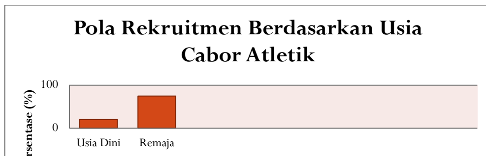
Tabel: Rekrutmen Atlet Atletik Kabupaten Landak membutuhkan waktu yang cukup panjang.