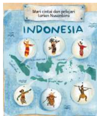
Data 6. Literasi Budaya berbentuk Tradisi

Tradisi dapat diartikan sebagai kebiasaan, kepercayaan, atau pola perilaku yang telah diwariskan secara turun-temurun dari generasi ke generasi dan menjadi bagian penting dalam kehidupan suatu kelompok masyarakat (Chasanah, 2024). Tradisi mengandung aturan, makna, simbol, dan cara hidup yang dipercaya oleh masyarakat. Oleh karena itu, tradisi menjadi sarana seseorang belajar memahami budaya mereka sendiri. Berikut ini contoh data literasi budaya dalam bentuk tradisi.