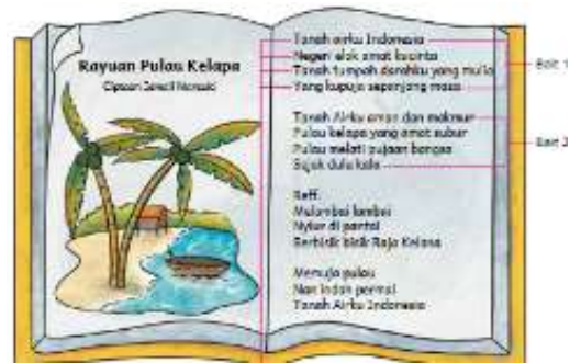
Data 5. Literasi Budaya berbentuk Nilai

Literasi budaya selanjutnya adalah adalah nilai. Nilai merupakan sesuatu yang dianggap penting dan benar oleh kelompok masyarakat, di mana nilai dapat dijadikan prinsip atau pedoman hidup bagi individu (Slamet et al., 2024). Nilai dalam penelitian ini berkaitan dengan lagu wajib nasional. Berikut data yang menunjukkan bentuk nilai yang mengintegrasikan dengan literasi budaya.