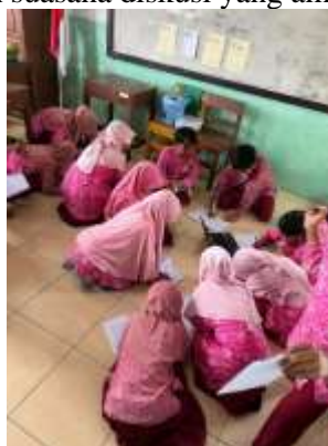
Gambar 1. Siswa membentuk kelompok tanpa membeda-bedakan kemampuan