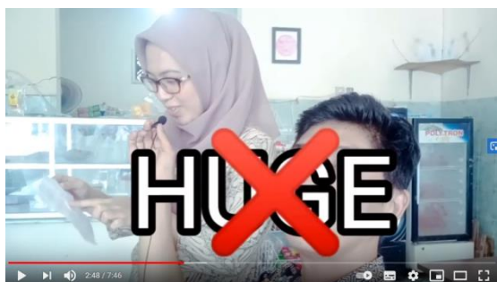
Gambar 2. Analisa baca kata

Sampel populasi penelitian berdasarkan asumsi bahwa mahasiswa tersebut memiliki karakteristik yang relatif sama, misalnya: memiliki rata-rata umur yang relatif sama, menggunakan fasilitas pembelajaran yang relatif sama, serta dibelajarkan oleh guru yang memiliki latar belakang pendidikan yang relatif sama. Pemilihan mahasiswa sebagai sampel dalam penelitian memungkinkan dengan alasan mahasiswa saat ini sudah mampu menguasai IPTEK. Mereka dapat mendownload materi pembelajaran dari handphone (HP) mereka. Selain itu mahasiswa sudah mampu menguasai internet karena standar kompetensi untuk pelajaran TIK (teknologi informasi komunikasi) memuat tentang internet.