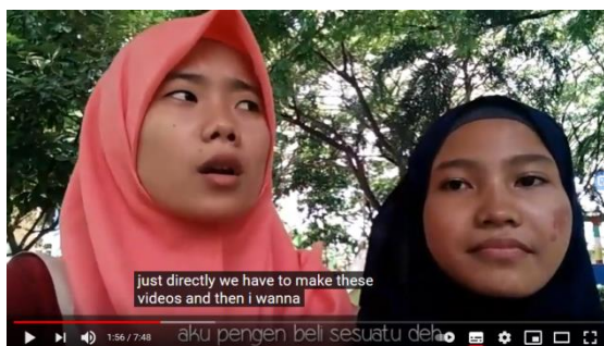
Gambar 1. Belajar berbicara bahasa inggris

Penelitian ini akan dilaksanakan pada kampus Universitas Muhadi Setibudi, pada penelitian ini diawali dengan melakukan peninjauan ke lokasi penelitian untuk mengetahui secara cermat. Teknik analisa data yang digunakan dalam penulisan jurnal adalah analisa content.