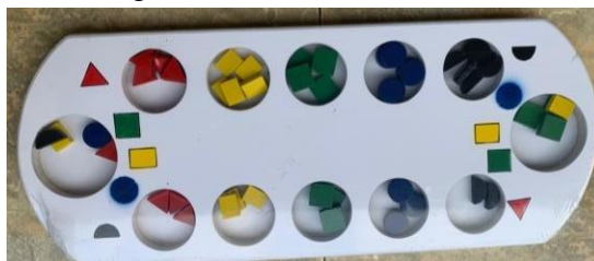
Gambar 3. Permainan Congklak yang dikembangkan Peneliti

Konstruksi produk dilakukan oleh tukang kayu yang ahli dibidang pembuatan alat permainan edukatif. Berikut ini merupakan desain konstruksi produk pengembangan permainan congklak untuk memfasilitasi pemahaman geometri.