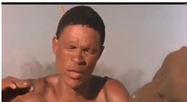
( Scene 9 pada menit 01.27.06)