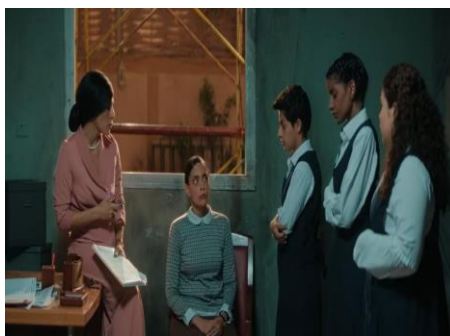
Gambar 3. Adegan interogasi tiga siswi oleh Kepala Sekolah (51:46)

Menurut klasifikasi konflik sosial yang dikemukakan oleh Soerjono Soekanto, adegan ini termasuk dalam kategori pertentangan antarkelas sosial, karena melibatkan kelompok dominan dan subordinat yang memiliki kepentingan berbeda. Penyalahgunaan wewenang serta ketimpangan relasi kuasa menjadi faktor utama yang memicu terjadinya konflik tersebut.