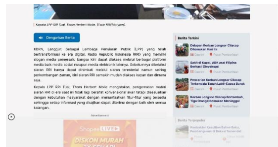
Gambar 1: Bukti RRI Melakukan Transformasi

Dalam situasi ini, RRI Pekanbaru menjadi contoh yang menarik untuk diteliti karena terletak di area yang mengalami perkembangan pesat dalam penggunaan media digital. Meningkatnya akses internet di Provinsi Riau telah mendorong perubahan besar dalam cara orang mendapatkan informasi, termasuk dari siaran radio. Kini, masyarakat tidak hanya mendengarkan konten melalui gelombang radio tradisional, tetapi juga melalui platform digital seperti RRI Digital, website streaming, dan media sosial yang lebih interaktif dan mudah diakses kapanpun (Akbar et al., 2023). Perubahan ini mendorong RRI Pekanbaru untuk melakukan transformasi, terutama dalam sistem produksinya, yang mencakup penggunaan alat siaran berbasis digital dan pengembangan konten yang disesuaikan untuk berbagai platform. Transformasi ini menjadi krusial karena audiens masa kini mengharapkan fleksibilitas, akses yang mudah, dan relevansi konten dengan kebutuhan mereka sehari-hari.