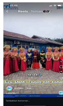
Gambar 4 Contoh Program Pro 2

Sementara itu, Pro 2, yang lebih menargetkan generasi muda, sangat aktif dalam distribusi melalui media sosial dan aplikasi digital. Produksi konten Pro 2 mencakup video musik lokal, vlog komunitas, liputan kreatif, dan podcast ringan, yang lebih menarik bagi audiens muda yang mengonsumsi konten visual dan dinamis. Temuan ini sejalan dengan penelitian (Maharani, 2021) yang mengungkap bahwa audiens muda RRI di berbagai daerah memiliki kecenderungan kuat beralih dari siaran radio linear menuju platform digital dan media sosial, karena konten digital lebih mudah diakses, lebih menarik secara visual, dan dapat diulang kapan pun. Hal ini membuat kanal Pro 2 melakukan adaptasi besar dalam strategi penyiaran agar sesuai dengan pola konsumsi audiens muda yang mengutamakan fleksibilitas dan on-demand content .