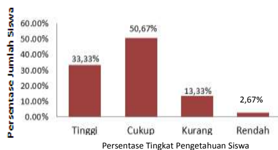
Gambar 1. Grafik Penafsiran Tingkat Kecenderungan Skor Tes Pengetahuan Siswa pada Materi Sistem Pernapasan Manusia

Berdasarkan hasil analisis data yang diperoleh dari tes pengetahuan siswa pada materi Sistem Pernapasan Manusia dengan jumlah siswa 75 orang diketahui skor tertinggi 92 dan skor terendah 20. Penafsiran tingkat kecenderungan skor tes pengetahuan siswa pada materi Sistem Pernapasan Manusia ditunjukkan pada gambar berikut.